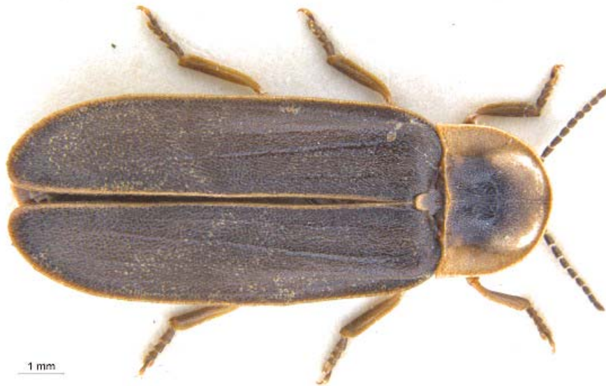
Das Grosse Leuchtkäfer-Männchen ( Lampyris noctiluca )