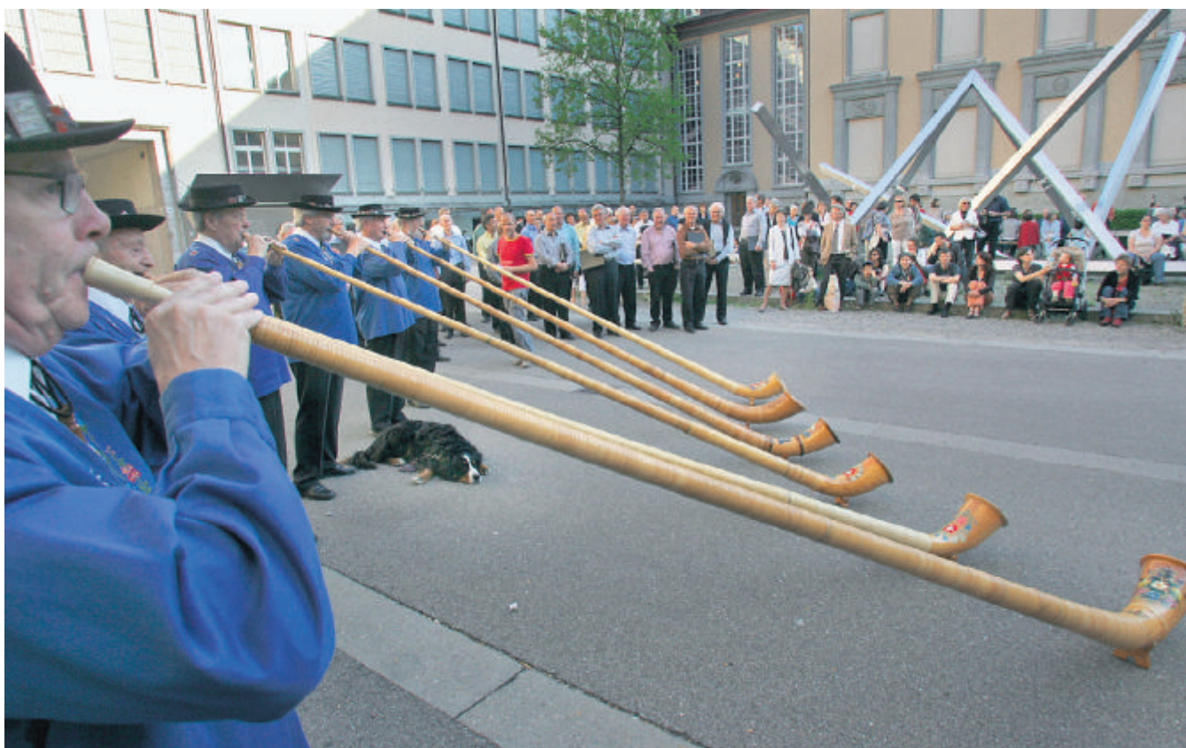
Ein ungewohntes Bild im Hof des Bezirksgerichts: Zwölf Mannen und Frauen der Alphornbläservereinigung Zürich.

Noch bis zum 6. Juni «lösen unerhörte Klänge ein ungekanntes Hofgefühl aus». 75 Chöre, 2000 Sängerinnen und Sänger singen in 150 Höfen. Detailliertes Programm: www.hofgesang.ch . (roc)